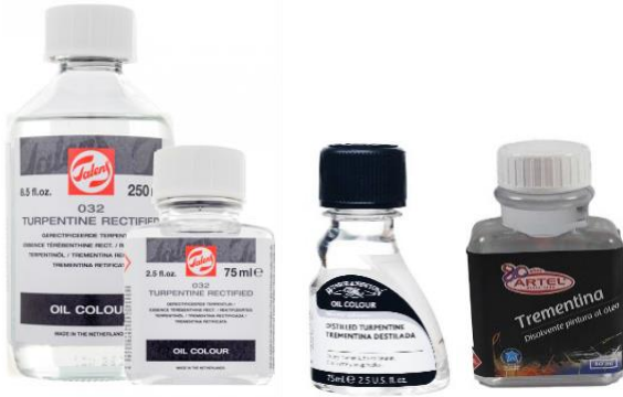
Ilustración 1 Diferentes marcas de trementina