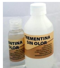
Ilustración 2 Trementina sin olor

Se trata de un producto derivado del petróleo y que permite un trabajo al interior de talleres colectivos como los que se realizan en la municipalidad de Las Condes pues al no tener el olor característico de este genera problemas respiratorios o irritación ocular entre otras molestias. tomando en cuenta que nuestros cursos se realizan principalmente en del año.