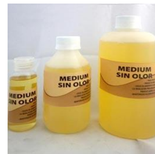
Ilustración 3 Medium sin olor

El médium para oleo es una mezcla de trementina, aceite de linaza y veces una pequeña cantidad de barniz. Es el principal solvente a utilizar proceso de pintar una obra al óleo pues al juntar el disolvente (trementina), con el vehículo (aceite de linaza), otorga a la capa ligereza si perder la capacidad de cubrir. Es la elección cuando estamos de pintar con cantidades mayores de pintura. También es indispensable trabajo de veladuras.