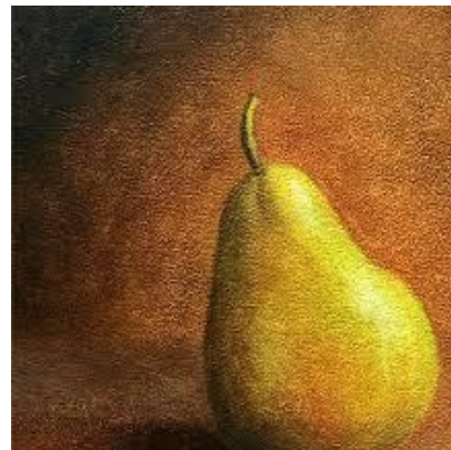
Ilustración 5 La misma pintura anterior, en etapa final, con sus empastes y el modelado de la luz a la sombra