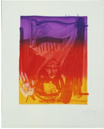
Jasper Johns. Figura 7 . (De la serie Color Numerals ). 1969. Litografía a color. Impresión 71.4 x 56.9 cm. Lamina: 96.5 x 78.7 cm. Colección: Museum of Modern Arts. NY.